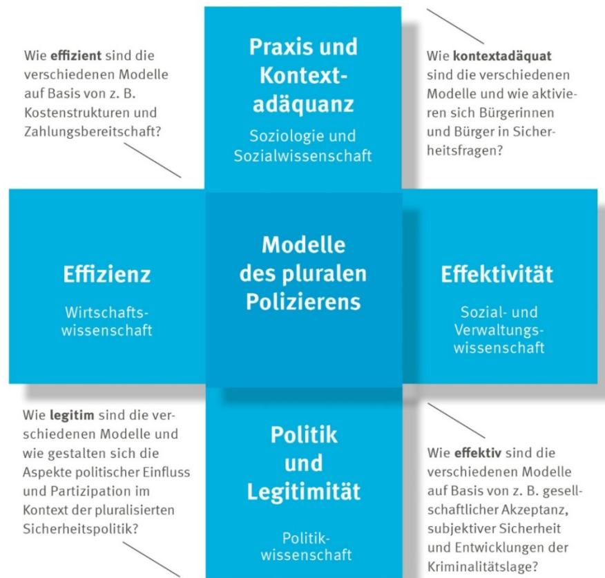
Abbildung 2: Anspruchsdimensionen und Forschungsperspektiven